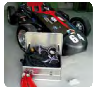
Abb. Best.-Nr. 11136