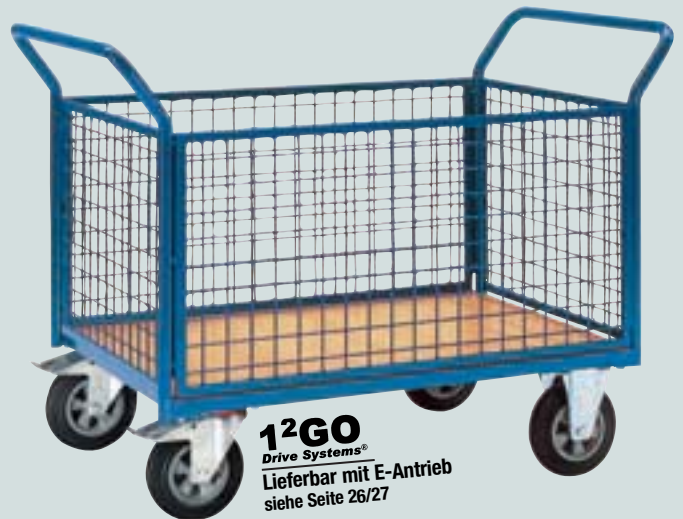
② Vierwandwagen mit Gitterwänden (Vorderwand herausnehmbar)