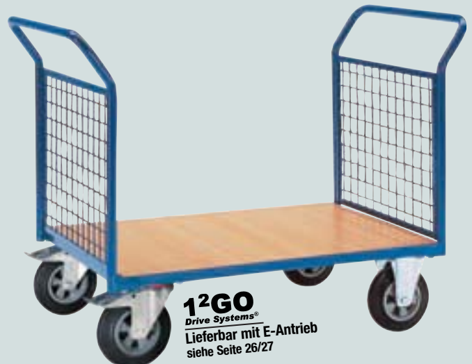
⑥ Doppelstirnwandwagen mit Gitter-Stirnwand