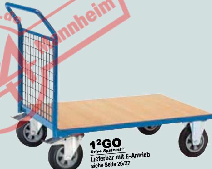
④ Stirnwandwagen mit Gitter-Stirnwand