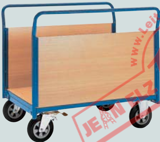
③ Seitenwandwagen mit Holzwänden