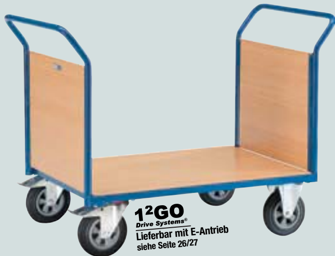
⑤ Doppelstirnwandwagen mit Holz-Stirnwand