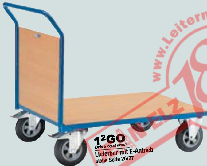
③ Stirnwandwagen mit Holz-Stirnwand