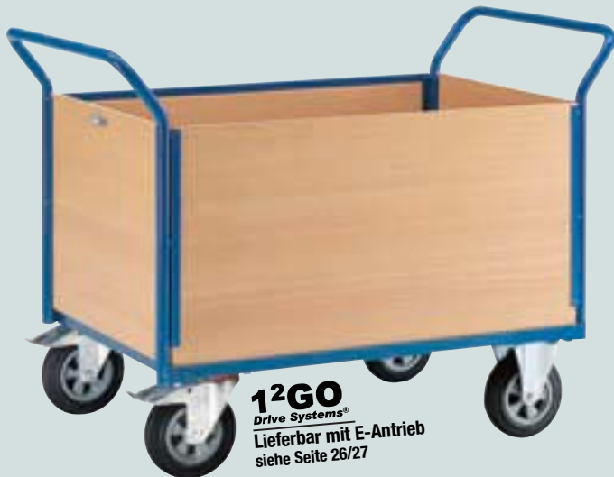
① Vierwandwagen mit Holzwänden (Vorderwand herausnehmbar)