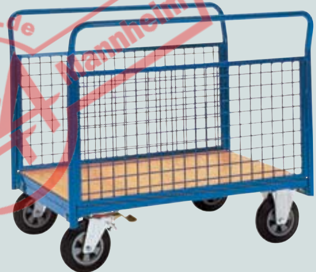
④ Seitenwandwagen mit Gitterwänden