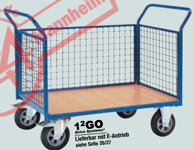
⑧ Dreiwandwagen mit Gitterwänden