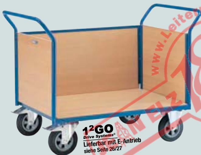
⑦ Dreiwandwagen mit Holzwänden