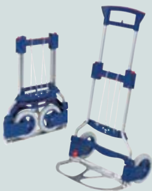
RuXXac®-cart bag Die Tasche zur Karre