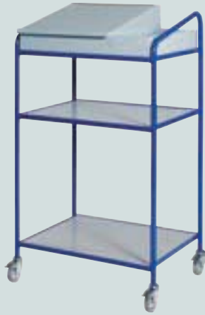
② offen mit Pultkasten + Ablagefach