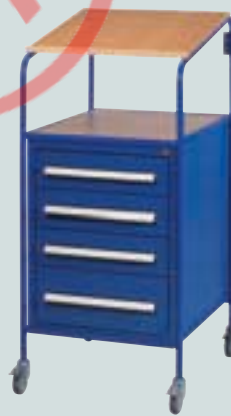
⑦ mit Schubladenschrank