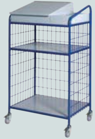
④ 3-seitig Gitter mit Pultkasten + Ablagefach