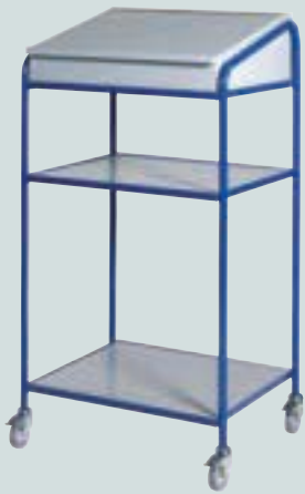
① offen mit Pultkasten