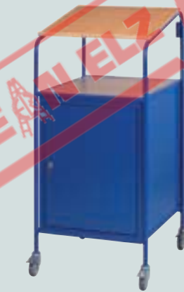
⑥ mit Flügeltürschrank