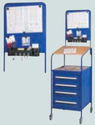
⑧ Pinboard aufsteckbar auf die Modelle ⑤ - ⑦