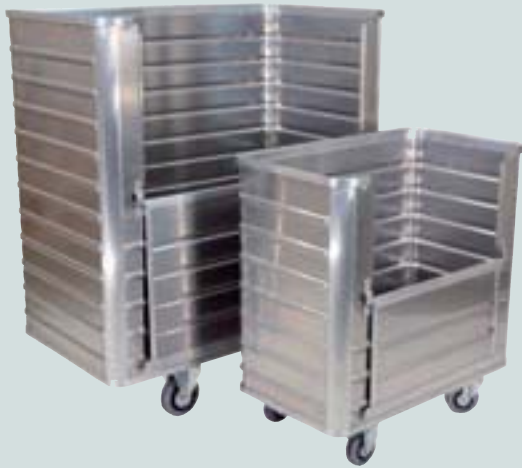
① mit abklappbarer Längswand