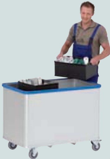
③ mit Federboden