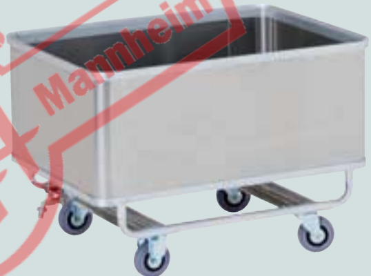
④ wasserdicht verschweißt und mit Ablaufhahn