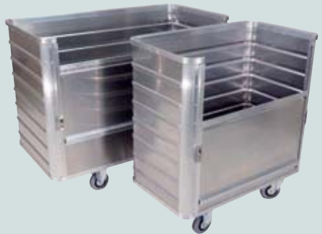
② mit absenkbarer Längswand