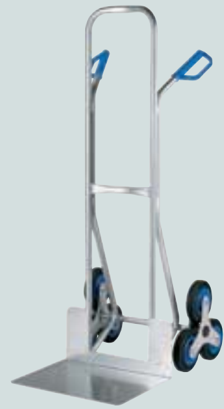
Kistenkarre Dreistern, breite Schaufel