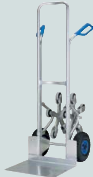
Kistenkarre Fünfstern, breite Schaufel