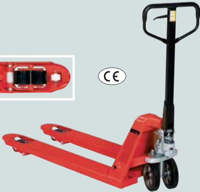
① kunststoffbeschichtet, RAL 2002