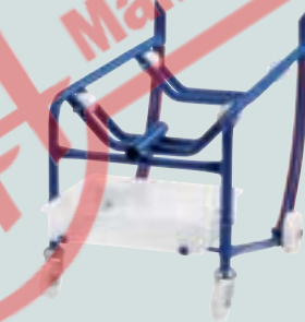
Mit Tropfwanne aus Polyethylen und Auflagerollen