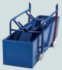
Mit Auffangwanne 213 Liter und Auflagerollen