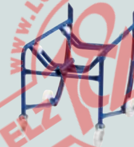
Standard mit Auflagerollen