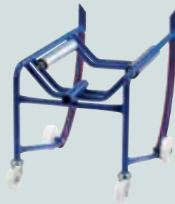
Standard mit Auflegewalzen