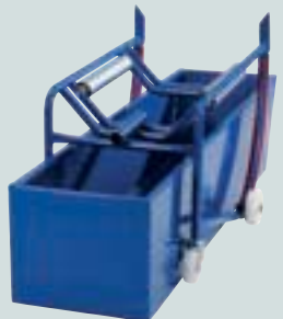
Mit Auffangwanne 213 Liter und Auflegewalzen