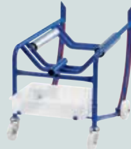
Mit Tropfwanne aus Polyethylen und Auflegewalzen