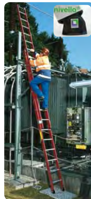
Abb. Best.-Nr. 35214