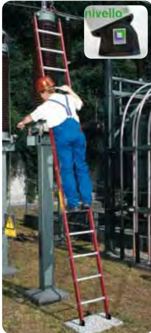
Abb. Best.-Nr. 35014