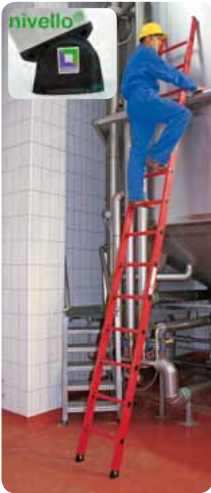
Abb. Best.-Nr. 36014