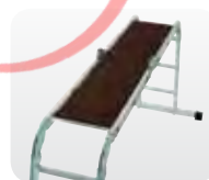
Abb. Best.-Nr. 30300