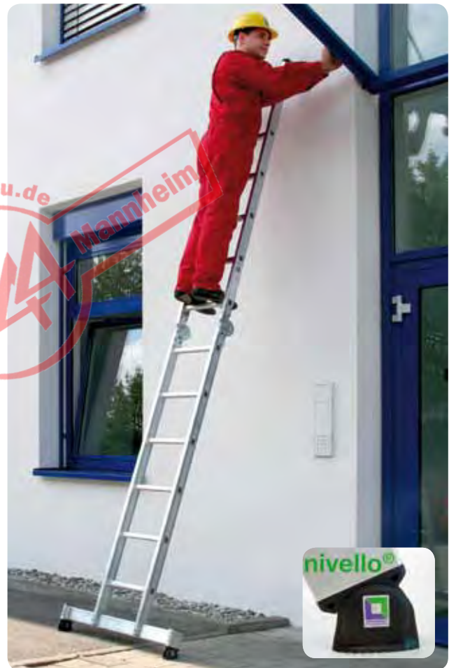
Abb. Best.-Nr. 32212