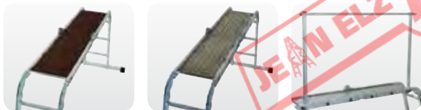
Abb. Best.-Nr. 30300