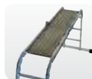
Abb. Best.-Nr. 30303