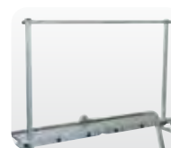
Abb. Best.-Nr. 30305 und Best.-Nr. 30303