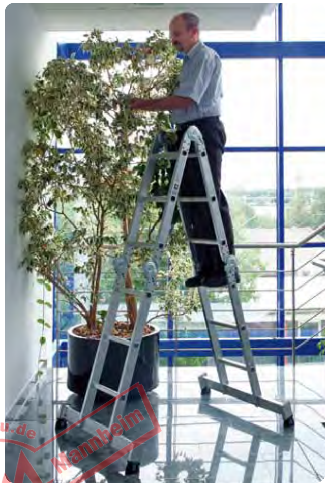
Abb. Best.-Nr. 31312