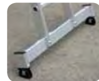
Abb. Best.-Nr. 22416