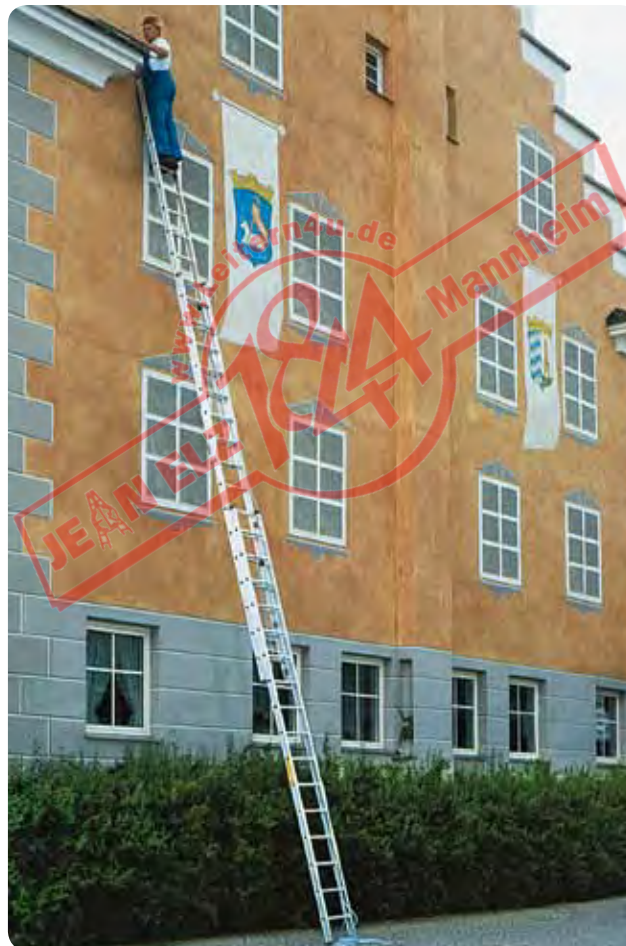
Abb. Best.-Nr. 22316

3-teilig; automatisch wirkende Einfallhaken, Höhenverstellung durch 2 Seilzüge, dadurch können Mittel- und Oberleiter jeweils von Sprosse zu Sprosse verstellt werden; Oberleiter mit Wandlaufrollen; rutschsichere nivello®-Leiterschuhe.