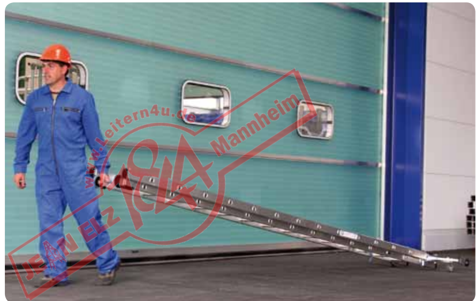
Abb. Best.-Nr. 21414