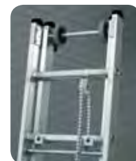
Abb. Best.-Nr. 21214