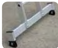
Abb. Best.-Nr. 21314