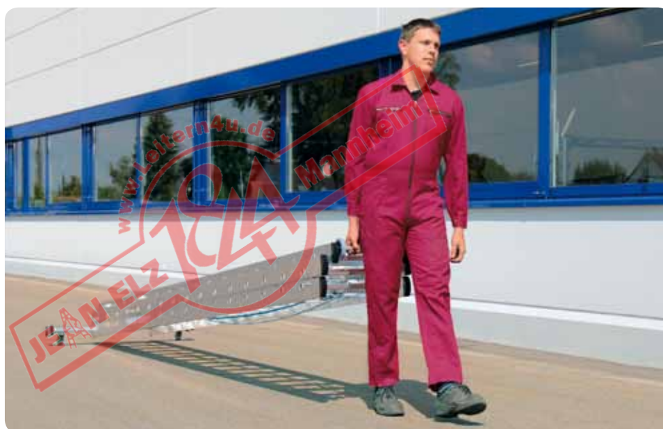
Abb. Best.-Nr. 22516