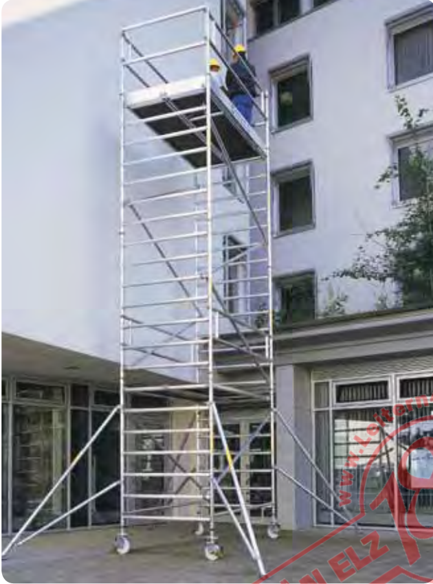
Abb. Best.-Nr. 168635