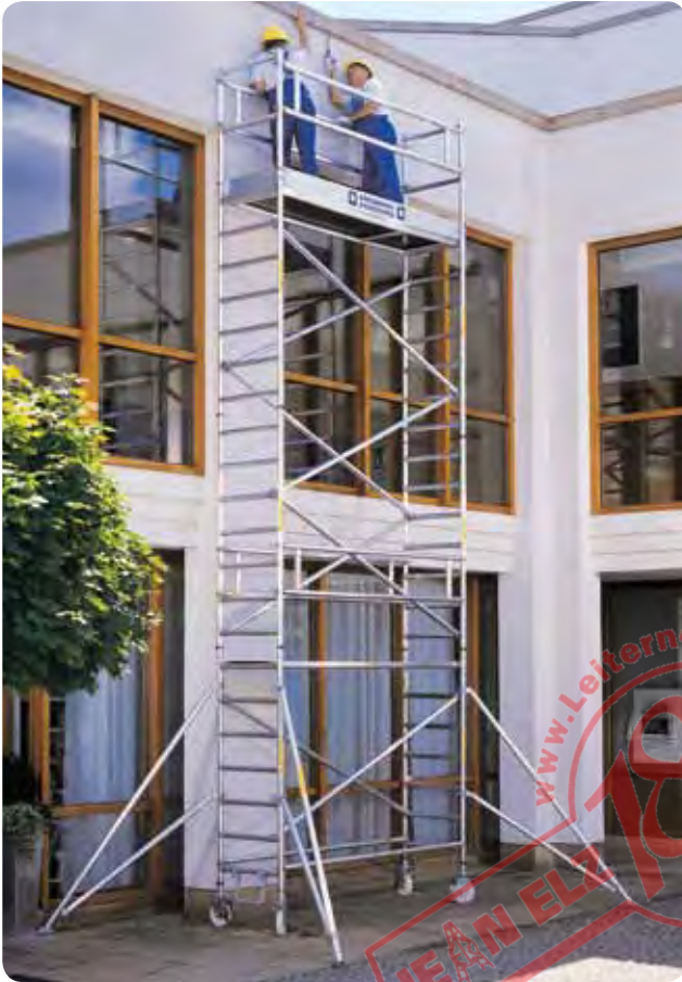
Abb. Best.-Nr. 178635