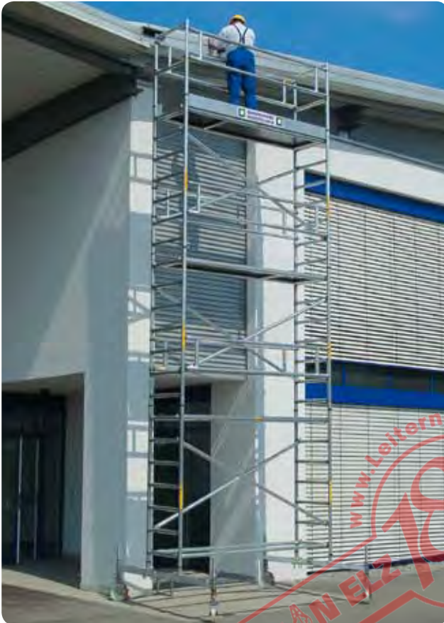
Abb. Best.-Nr. 155645

Für bequemes Handling und sicheren Stand sorgen 4 Lenkrollen \varnothing 200 mm mit zentrischer Lasteinleitung, mit Feststellern und Spindeln für Höhenausgleich.