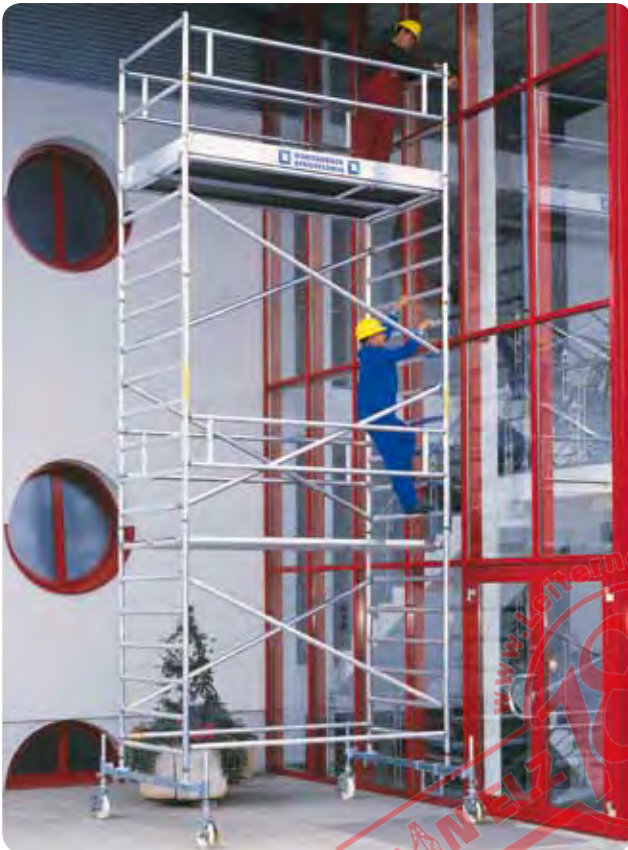
Abb. Best.-Nr. 174535