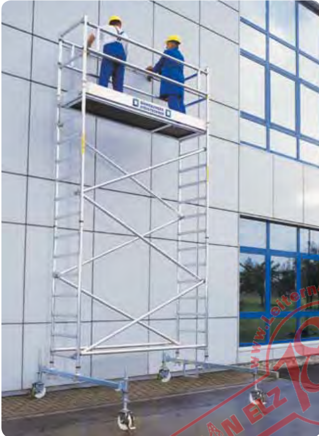
Abb. Best.-Nr. 171435