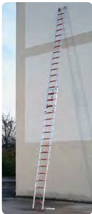
Abb. Best.-Nr. 115010