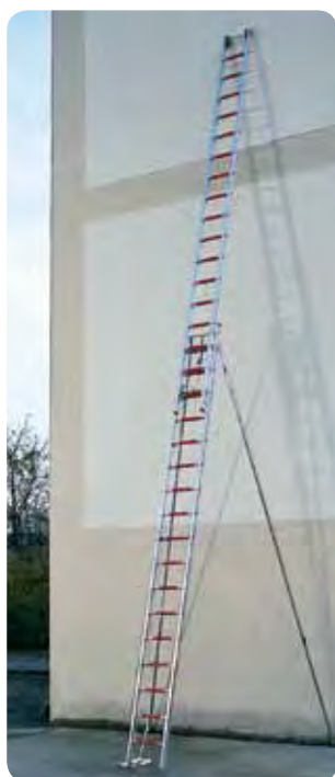
Abb. Best.-Nr. 115011