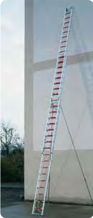
Abb. Best.-Nr. 115007