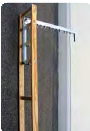
Abb. Best.-Nr. 110006