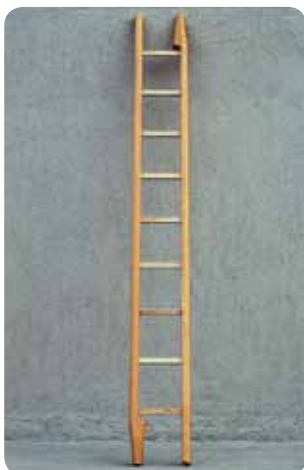
Abb. Best.-Nr. 110007