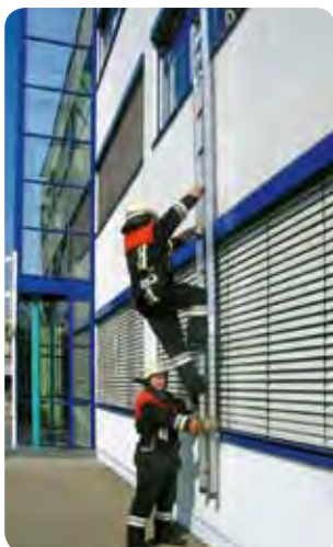
Abb. Best.-Nr. 115006